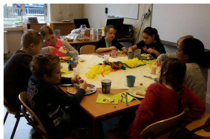
Hierboven een foto van het lenteontbijt in groep 5/6.

Al deze nieuwe zaken zorgen voor een gevoel van een frisse lente start!